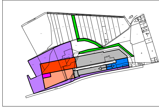
SCHÉMA PODMÍNEK PROSTOROVÉHO USPOŘÁDÁNÍ ÚZEMÍ ZMĚNY Č. 4 ÚPO ČAKOVIČKY